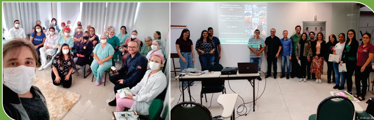
Palestra e treinamento na Fundação Hospitalar de Três Barras (SC)

Foi realizada também, uma palestra com a Associação dos Engenheiros e Arquitetos do Vale de Canoinhas (AEVC), para empresas e órgãos públicos, acerca da legislação relacionada ao gerenciamento e destinação adequada de resíduos no Estado de Santa Catarina. Esta palestra foi aberta ao público, teve duração de dois dias e ocorreu no Centro Empresarial de Canoinhas - ACIC.