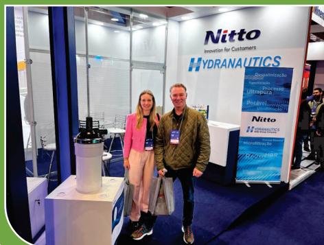
Visita a feira (FENASAN) em São Paulo.