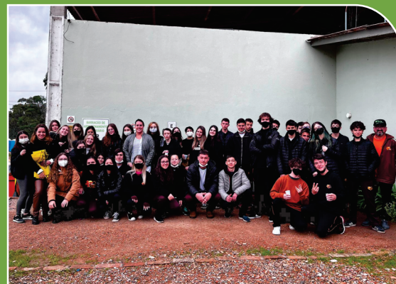
Turma vencedora da gincana, visitando a empresa e aula prática das matérias de química, biologia e cidadania.

13 AÇÃO CONTRA A MUDANÇA GLOBAL DO CLIMA