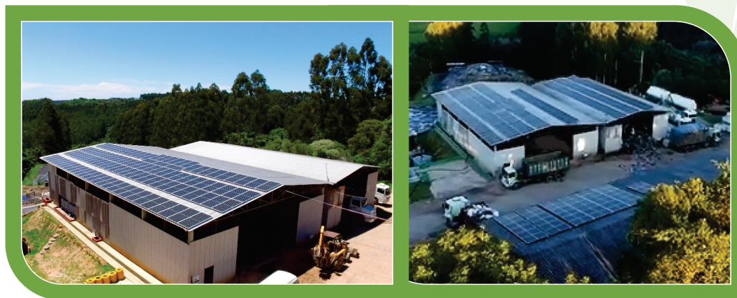
Ampliação de painéis fotovoltaicos na empresa, de 2021 para 2022.

E para 2023, estamos planejando alcançar a capacidade de 70% da produção de energia solar, em nossas operações.