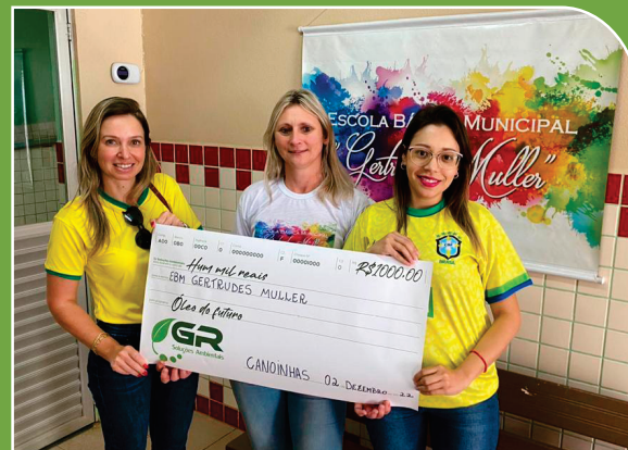
Escola Básica Municipal Gertrudes Müller, recebeu o valor de R$1.000,00

13 AÇÃO CONTRA A MUDANÇA GLOBAL DO CLIMA