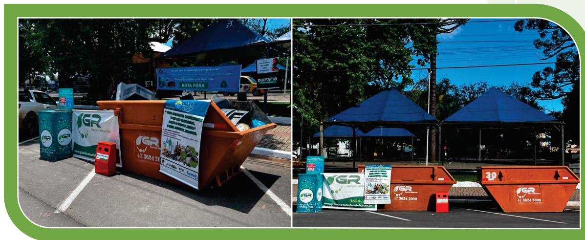
Caçambas disponibilizadas no centro da cidade, para o campanha "Semana do Lixo Zero".

Também foram promovidas palestras e orientações sobre o descarte adequado de resíduos, impactando positivamente no meio ambiente e na conscientização da população local.