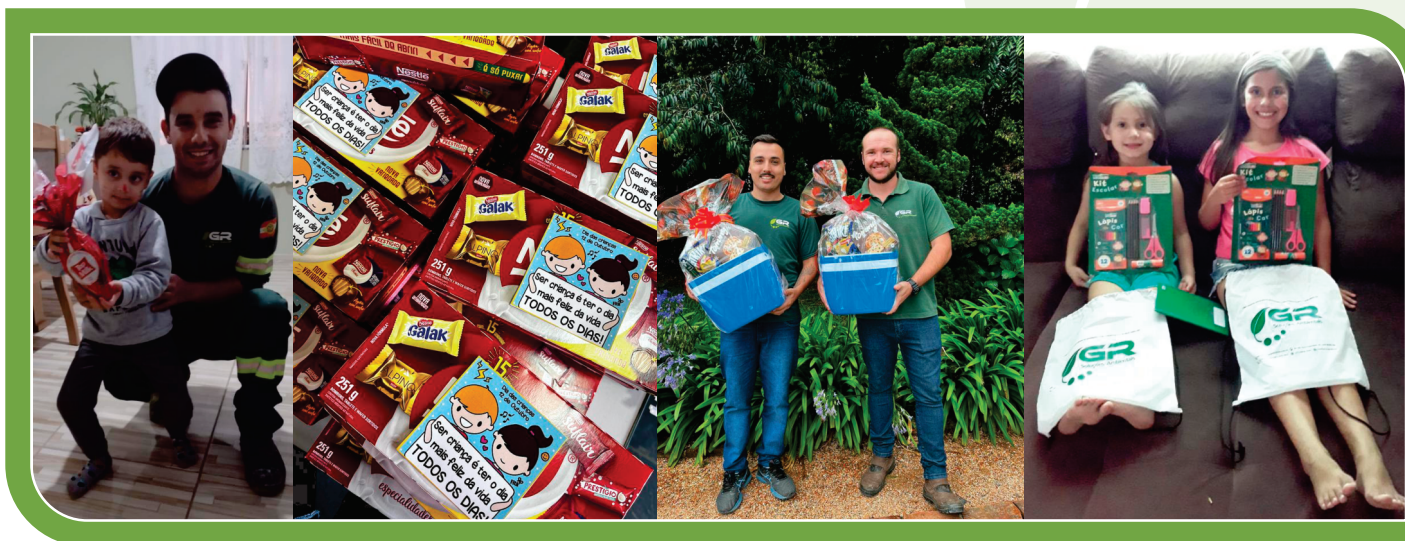
Presentes distribuídos aos colaboradores e filhos, em épocas comemorativas e escolares