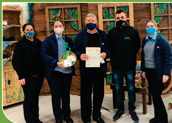
Equipe da empresa Mili, recebendo o prêmio “Frigideira Dourada” pela arrecadação de óleo de cozinha.

Para as empresas que mais fazem doação do óleo de cozinha, a GR entrega um prêmio simbólico, pela sua colaboração e responsabilidade com o meio ambiente. O custo total do programa de coleta de óleo usado, é de aproximadamente R$8.500,00.