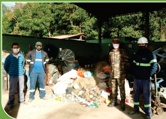
Descarte de materiais apreendidos realizado pela Polícia Militar Ambiental de Canoinhas

Em Canoinhas, a GR também auxilia, sempre que solicitada, instituições que lutam pelos direitos da causa animal, doando seu material britado para por exemplo, lar de abrigo temporário de animais.