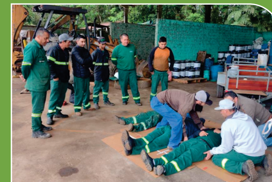
Treinamento de primeiros socorros, trabalhos em espaço confinado e altura