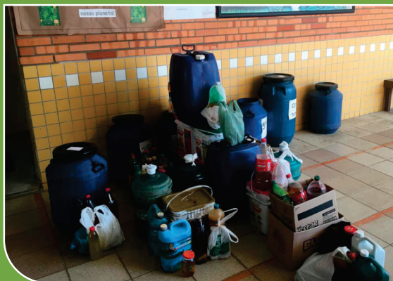
Óleo de cozinha usado, arrecadado durante a gincana na escola.

A Escola de Educação Básica Tempo Feliz, realizou uma gincana educativa com os alunos, onde além de abordar temas relevantes ao meio ambiente, foi coletado também óleo de cozinha usado. O grupo ganhador, realizou uma visita técnica nas dependências da GR Soluções Ambientais, para conhecer todo o processo de recebimento, tratamento e destinação final de resíduos.