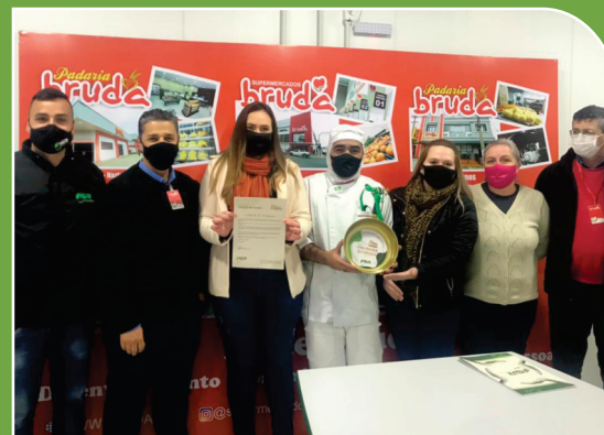
Equipe do Supermercados Bruda, recebendo o prêmio “Frigideira Dourada”.

13 AÇÃO CONTRA A MUDANÇA GLOBAL DO CLIMA