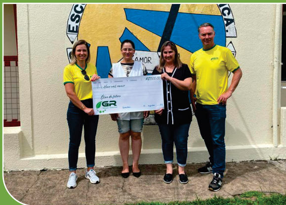
Escola de Educação Básica João José de Souza Cabral, recebeu o valor de R$1.000,00

Durante o ano de 2022, a GR manteve 136 pontos de coleta de óleo de cozinha usado, totalizando 25.723 litros coletados. Esse programa de coleta, existe há mais de 10 anos, e contribui significativamente para a preservação do meio ambiente, evitando a poluição do solo e da água. Além disso, a empresa promoveu a educação ambiental nas escolas em forma de gincana, doando os valores arrecadados com o óleo da reciclagem, foram repassados R$ 2.000,00 para duas escolas do município, em benefício dos alunos.